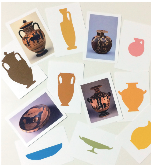
ギリシア陶器の写真とシルエット

・ご来館の際は、マスクの着用、手指の消毒、咳エチケットへのご協力をお願いします ・当日、体調の悪い方、発熱や咳き込み等の症状のある方はご参加いただけません ・諸般の事情により、プログラム内容を変更、中止する場合があります