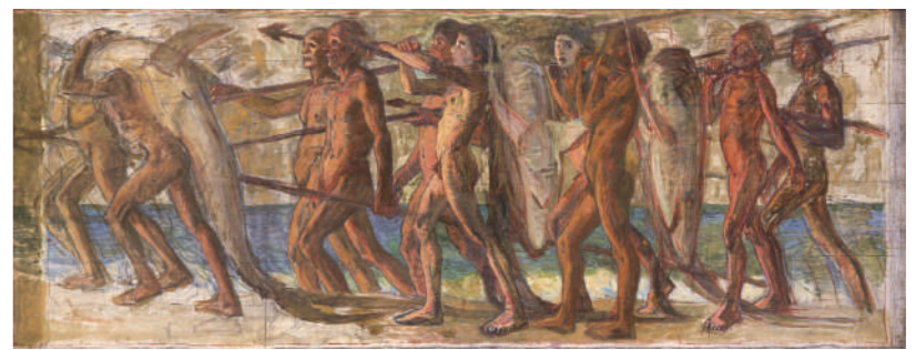
青木繁《海の幸》1904年 重要文化財 AOKI Shigeru, A Gift of the Sea , 1904 Important Cultural Property