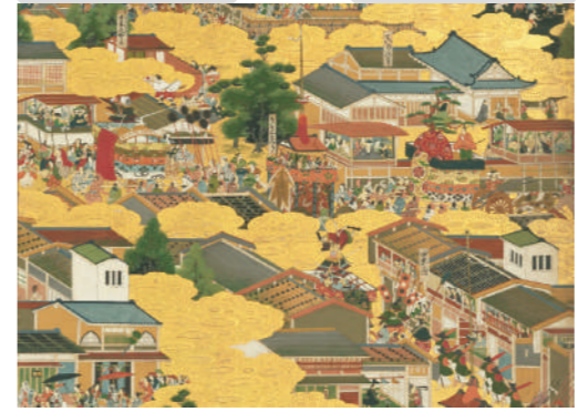
《洛中洛外図屏風》(部分) 江戸時代 Scenes in and around Kyoto, (detail) Edo period

An art museum serves as a device for conveying "what it means to be human" in an easy-to-understand way through forms of art. Human beings have created art over many hundreds of millenia. It is that unbroken chain that has brought us to the present and sets us on a path to evolve into the future. Humankind has left a superlative legacy in literature, music and theater, but surely there is no other area than art where, at a glance, we can instantly feel all our capabilities and potentials. It is art that teaches us about an exceeding ability of human creativity that we all have. While the museum has been closed, the Ishibashi Foundation collection that we all have. While the museum has been amassed around 2,800 works over more than 65 years. Its history of creativity, extending from antique art to the 21st century, can provide you with an environment to appreciate the moment when artists created form. Through the selected approximately 200 pieces, we invite you to experience works that weave together human history, linking the present moment with the past and the future.