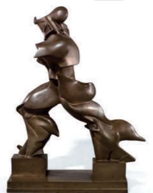
ウンベルト・ボッチョーニ 《空間における連続性の唯一の形態》 1913年 (1972年铸造) Umberto BOCCIONI, Unique Forms of Continuity in Space , 1913, cast 1972