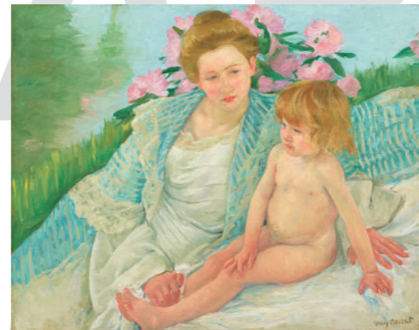
メアリー・カサット (日光浴 (浴後)) 1901年 Mary CASSATT, The Sun Bath (After the Bath) , 1901

美術館とは、「人間とはなにか」を、造形をとおりて分かりやすく伝える装置です。人間は過去、数万年にわたって形をつくってきました。その途切れることのない連鎖が、現在や未来の私たちを生かしています。人は文学や音楽、演劇などでもすぐれた成果を残してきましたが、美術ほど、私たちがもつ能力と可能性を一望の下に直ちに感じることができる分野はないでしょう。創造という人間がもつ輝かしい力を、美術は私たちに教えてくれます。休館中も収集活動を続けてきた石橋財団コレクションは、65年以上で約2,800点となりました。古代から21世紀までわたる創造の軌跡は、みなさまに、美術家たちが造形を生み出す瞬間と立ち会う場をご提供できるものです。この展覧会では選りすぐりの206点によって、今という時間が過去と未来をつなげ、人間の歴史を編んでいく営みにみなさまをお誘いします。