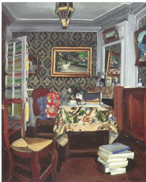
碓伊之助《室内》1928年、碓伊之助美術館