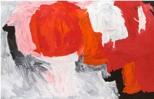
マダディンキンアーシー・ジュウォンダ・サリー・ガボリ《祖父の国》2011年、石橋財団アーティゾン美術館 ★ © Copyright Agency, Sydney & JASPAR, Tokyo, 2024 C4736