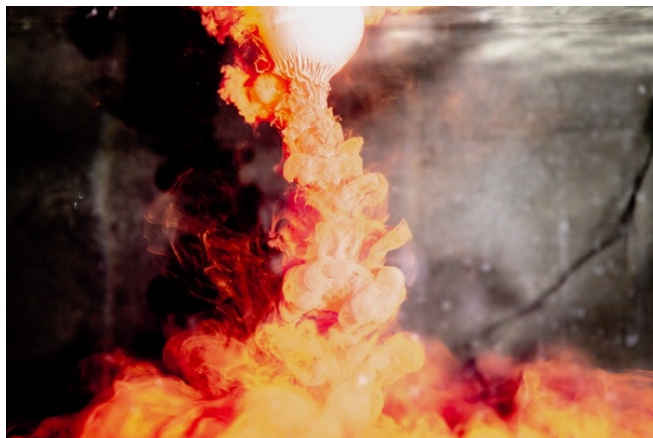
志賀理江子《Sadness》2023年、C-type プリント

アーティゾン美術館の開館から毎年開催している、石橋財団コレクションとアーティストとの共演、「ジャム・セッション」。第6回目となる本展は、山城知佳子と志賀理江子を迎えて開催します。近・現代日本が生み出した矛盾と抑圧、沖縄戦や集中する米軍基地など、生まれ育った土地がはらむ複雑で歪な状況を、ときにユーモアを交えて描き出す山城。2008年より宮城県を拠点とし、東日本大震災やそこからの復興、あるいはそれ以前から作用していた中心と周縁の不均衡な力学のなかに立ち現れる生のあり方に光を当てる志賀。ふたりの新作を通じて、過去から続く複雑で困難な現実に向き合う作家たちの真摯な態度、そして創造力と芸術という手法のあり方をコレクション作品のうちにも見出し、紹介します。