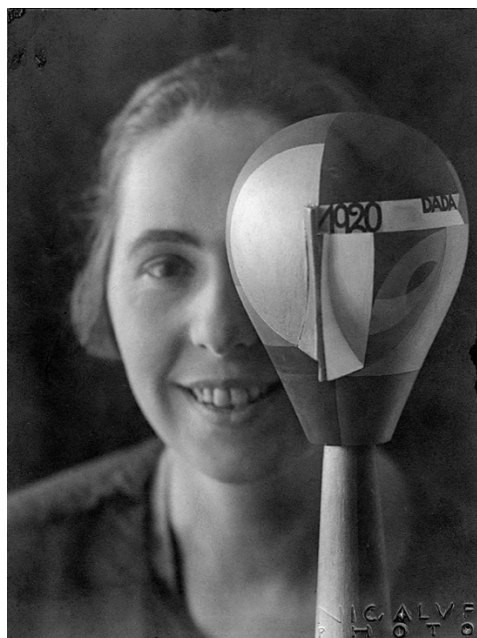
《「ダダ・ヘッド」とゾフィー・トイバー》1920年、アルプ財団、ベルリン/ローラントシュヴェルト