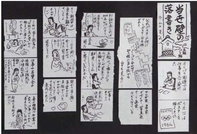
山口晃《当世壁の落書き》(部分) 2021年、作家蔵 ©YAMAGUCHI Akira, Courtesy of Mizuma Art Gallery