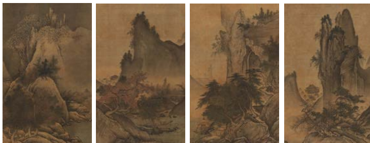
雪舟《四季山水図》室町時代 15世紀、石橋財団アーティゾン美術館、 重要文化財、右から春幅、夏幅、秋幅、冬幅