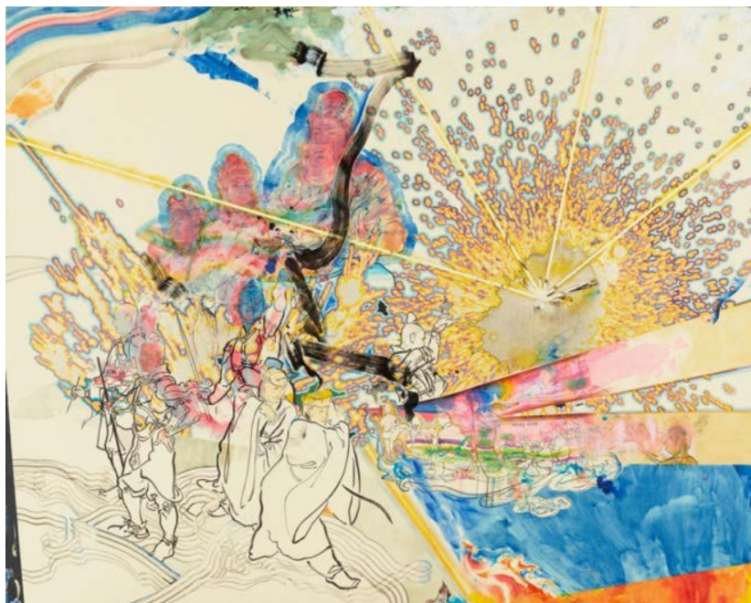
山口晃《来迎圖》2015年、作家蔵 ©YAMAGUCHI Akira, Courtesy of Mizuma Art Gallery

公益財団法人石橋財団アーティゾン美術館（館長 石橋 寛）は、石橋財団コレクションと現代美術家の共演「ジャム・セッション」の第4弾として「ジャム・セッション 石橋財団コレクション×山口晃 ここへきて やむに止まれぬ サンサシオン」を開催します。