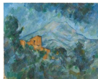
ポール・セザンヌ《サント=ヴィクトワール山と シャトー・ノワール》1904-06年頃、 石橋財団アーティゾン美術館