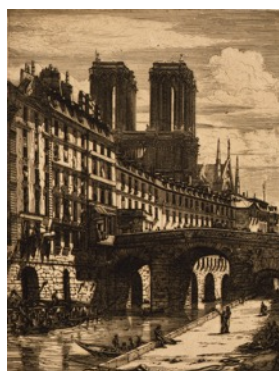
シャルル・メリヨン 《プティ・ボン》1852 年以降 エッチング、エングレーヴィング