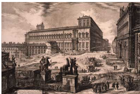
ジョヴァンニ・バッティスタ・ピラネージ 《クイリナーレ広場のディオスクーリ像 (『ローマの景観』より)》

4階展示室では石橋財団コレクション選をご紹介すると同時に特集コーナー展示を設け、当館コレクションの中から18世紀から19世紀にイタリアをはじめヨーロッパ各地で隆盛した都市景観画を選びすぐり、肖像画とともに田園と都市を家族との関わりに焦点を当て、その変遷を紐解きます。