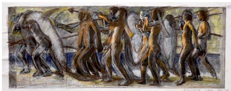
森村泰昌《M式「海の幸」習作（色合わせ01：假象の創造）》2020年

《海の幸》をテーマに10点の連作を制作するプロセスを、スケッチや資料、記録映像などで紹介します。