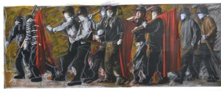
森村泰昌《M式「海の幸」習作（色合わせ06：われらの時代）》2021年