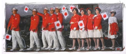
森村泰昌《M式「海の幸」習作（色合わせ05：復活の日1）》2021年