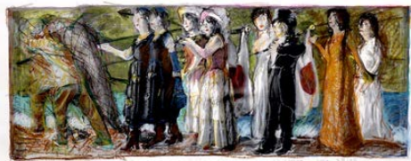
森村泰昌《M式「海の幸」習作（色合わせ02：それから）》2020年