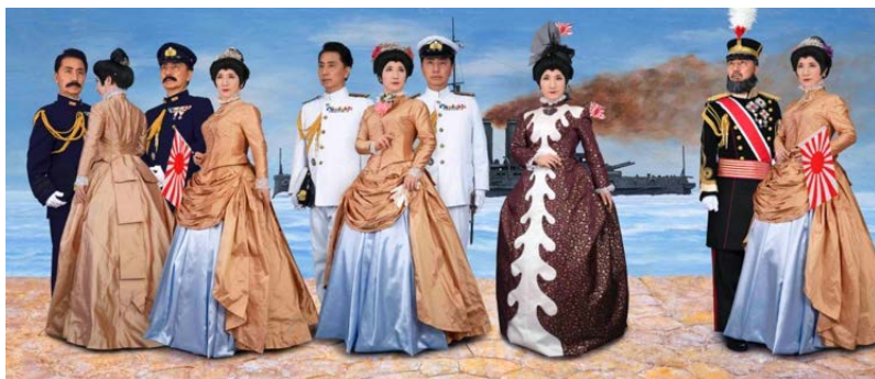
森村泰昌 《M式「海の幸」第2番：それから》 2021年 作家蔵