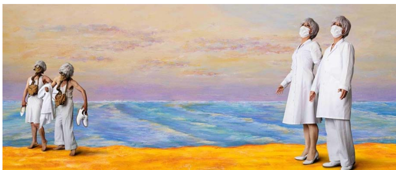
森村泰昌 《M式「海の幸」第9番：たそがれに還る》 2021年 作家蔵