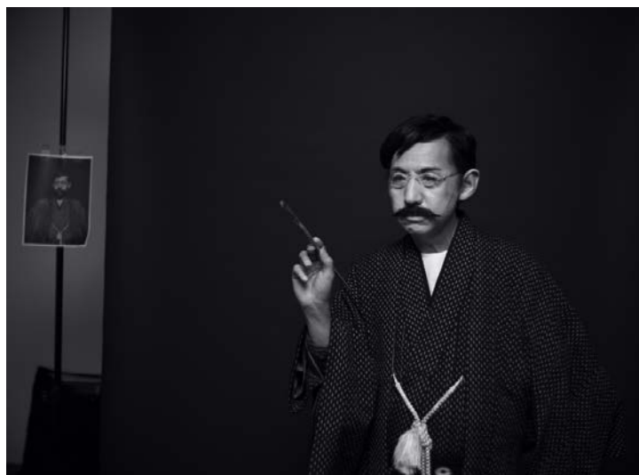
森村泰昌《ワタシガタリの神話》2021年（映像作品）より ★

石橋財団コレクションと現代美術家の共演「ジャム・セッション」の第2弾には、森村泰昌が登場。青木繁の《海の幸》に触発されて制作した最新作の大作10点を一挙公開。モリムラがたったひとりで85人の登場人物を演じ分けて語られる物語とは？明治、大正、昭和、そして現代から未来へ。我々はどこから来て、どこへ行くのか。歴史の行く末を問う絵巻物が展開する。