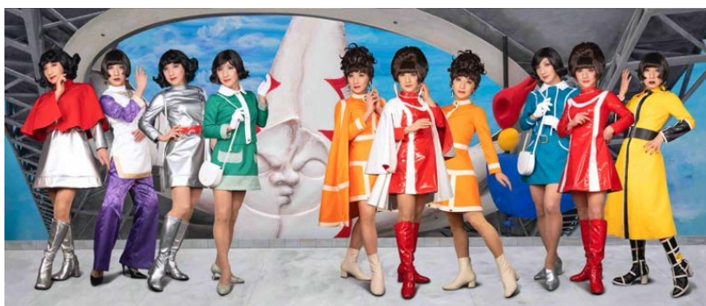
森村泰昌 《M式「海の幸」第7番：復活の日2》 2021年 作家蔵