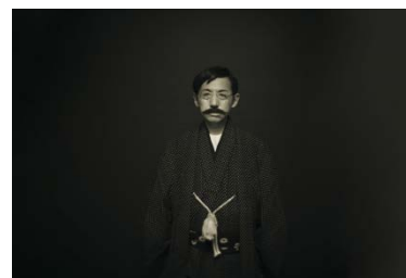
森村泰昌《ワタシガタリの神話》2021年（映像作品）より