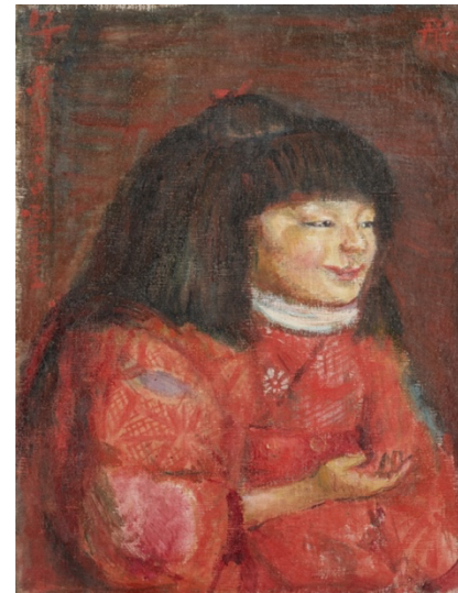
岸田劉生《麗子像》 1922年 テンペラ・カンヴァス