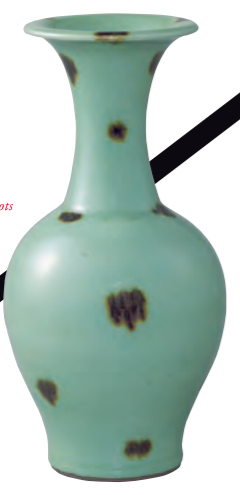
中国 龍泉窯 青磁鉄斑文瓶(飛青磁花瓶) 元時代 14世紀 重要文化財 — CHINA, Longquan ware Vase, celadon, decorated with iron brown spots Yüan dynasty, 14th century Important Cultural Property

美術館の展示室に整然とならぶ美術品、それらは、今日誰もが観賞することのできる公共的なものとなっています。ですが、その美術品が生まれた時のことを振り返ると、それは邸宅の建具として作られたり、プライベートな部屋を飾るためにえがかれたりと、それを所有する人との関係によって生み出されたものであることが分かります。また、時を経る間に、何人もの手を渡り、受け継がれてきたものもあります。この展覧会では、モネ、セザンヌ、藤田嗣治、岸田劉生、琳派による作品や抽象絵画まで、古今東西、様々な分野の作品からなる石橋財団コレクション約130点によって、美術品がどのような状況で生まれ、どのように扱われ、受け継いでこられたのか、その時々を想像し体感してみます。