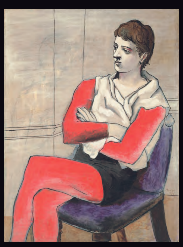
パブロ・ピカソ 腕を組んですわるサルタンバンク 1923年 — Pablo PICASSO Salimbanque Seated with Arms Crossed 1923

This work has been solidly popular since we acquired it in 1980. At one time, it was owned by the famous pianist Vladimir Horowitz. A photograph captures it hanging in his living room in New York, with Horowitz relaxing in front of it. Did viewing this painting change Horowitz's performances?