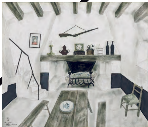
藤田嗣治 ドルドーニュの家 1940年 — FUJITA Tsuguharu Interior, House in Dordogne 1940 © Foundation Foujita / ADAGP, Paris & JASPAR, Tokyo, 2024 C4552

ユーモラスな動物たちの表現でおなじみのこちらの作品。当館が所蔵するのは掛け軸でおそらく多くの方がご存じなのは、国宝の長い絵巻でしょう。実は、こちらの作品も、かつては絵巻の一部でした。いつ、誰が、どんな事情で?と分割された謎は深まりますが、掛け軸になったことで、絵巻とはまた違った雰囲気を楽しめるかもしれません。