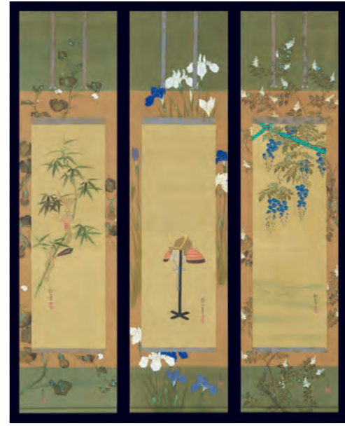
酒井抱一 / 鈴木其一 夏図(十二月月図の内) 江戸時代 19世紀 — SAKAI Hoitsu / SUZUKI Kiitsu Summer, from the Twelve Months Edo period, 19th century