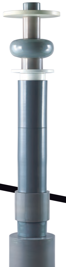
エットレ・ソットサス トーテムNo. 2 1964年(デザイン)/1996年(製作) — Ettore SOTTASS Totem No. 2 1964 (design) / 1996 (produce) © erede Ettore Sottsass, JASPAR, Tokyo, 2024 C4552

Today the works of art neatly displayed in a museum's gallery are public objects that anyone may enjoy seeing. Looking back to when those works were created, however, we realize that they were made as furnishings for a residence or painted to decorate a private room: they came about through a relationship with the person who owned them. Moreover, over time, they passed into other persons' hands or were inherited by later generations. This exhibition presents works by Monet, Cézanne, Fujita Tsuguharu, Kishida Ryusei, the Rinpa School, 130 highly varied works from the Ishibashi Foundation Collection from many fields and many times and places—ancient and modern, East and West. Through them, we explore the situations under which works of art were created and how they were treated and passed on. Visitors will have the opportunity to imagine and experience those many contexts.