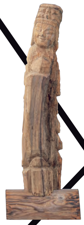
円空 仏像 江戸時代 17世紀 — ENKU Buddhist Image Edo period, 17th century