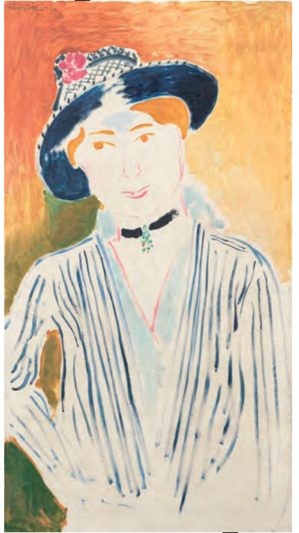
アンリ・マティス 縞ジャケット 1914年 — Henri MATISSE Striped Jacket 1914