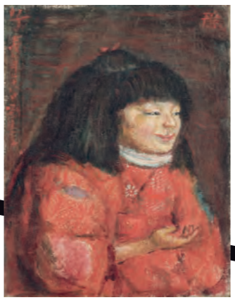
岸田劉生 麗子像 1922年 — KISHIDA Ryusei Portrait of Reiko 1922