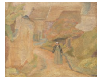
坂本繁二郎〈パリ郊外〉1923年 SAKAMOTO Hanjiro, Suburbs of Paris , 1923

Artists' letters record their feelings for their teachers and students, older and younger colleagues, friends, spouses, lovers, and children, their struggles with their work, and memorable anecdotes. They also sometimes provide glimpses of the artist's character and pattern of human relationships. Here we introduce works from the Ishibashi Foundation Collection associated with letters by Sakamoto Hanjiro and other artists as well as the letters themselves.