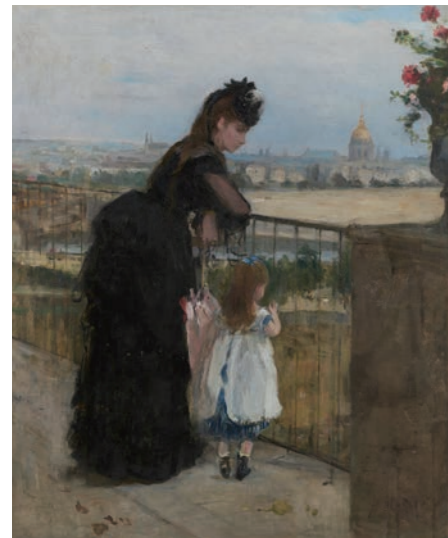
ベルト・モリソ〈バルコニーの女と子ども〉1872年 Berthe MORISOT, Woman and Child on the Balcony , 1872

Delighting in Art—Seeing, Feeling, Learning