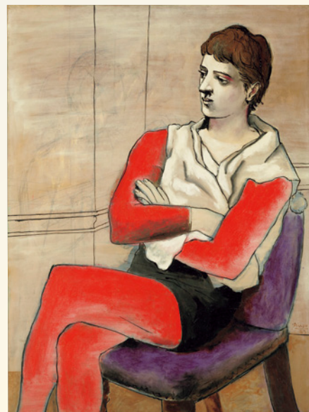
パブロ・ピカソ《腕を組んですわるサルタンバンク》1923年 Pablo PICASSO, Saltimbanque Seated with Arms Crossed, 1923

内容は「肖像画のひとコマ——絵や彫刻の人になってみよう」、「風景画への旅——描かれた景色に浸ってみよう」、「印象派の日常空間——近代都市パリに行ってみよう」の3つのセクションで構成します。作品をじっくりご覧いただき、存分にその世界を感じ、さらにより深く学んでいただく機会をご提供します。