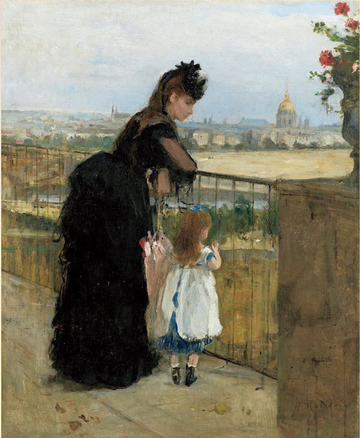
ヘルト・モリソン『バルコニーの女と子と』1872年 Berthe MORISOT, Woman and Child on the Balcony, 1872

Organized by Artizon Museum, Ishibashi Foundation