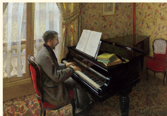
ギュスターヴ・カイユボット《ピアノを弾く若い男》1876年 Gustave CAILLEBOTTE, Young Man Playing the Piano , 1876