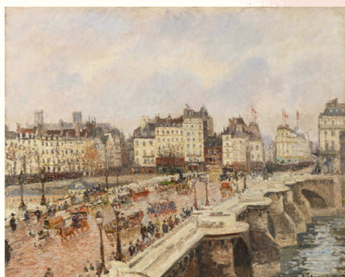
カミーユ・ピサロ《ボンヌヌフ》1902年 公益財団法人ひろしま美術館蔵 Camille Pissarro, The Pont-Neuf , 1902, Hiroshima Museum of Art

作品保護のため、展示替えがあります。 展示期間をご確認のうえ、ご来館ください。 会期 2020年11月14日(土) - 2021年1月24日(日) 前期 2020年11月14日(土) - 12月20日(日) 後期 12月22日(火) - 2021年1月24日(日) 関連プログラム 当館ウェブサイトにて、お知らせいたします。 www.artizon-museum/program