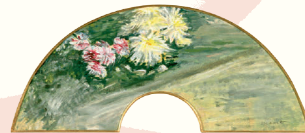
エドゥアール・マネ《白菊の図》1881年頃 茨城県近代美術館蔵 Edouard Manet, Chrysanthemums , c.1881, The Museum of Modern Art, Ibaraki