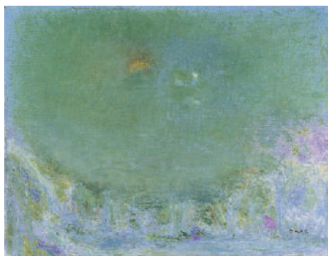
坂本繁二郎《幽光》1969年 石橋財団アーティゾン美術館蔵 Sakamoto Hanjiro, Dim Light , 1969 Artizon Museum, Ishibashi Foundation