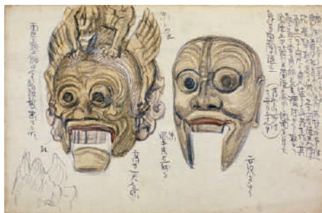
青木繁《舞楽面》1900-03年頃 石橋財団アーティゾン美術館蔵 Aoki Shigeru, Sketches of Bugaku Masks , c.1900-03 Artizon Museum, Ishibashi Foundation