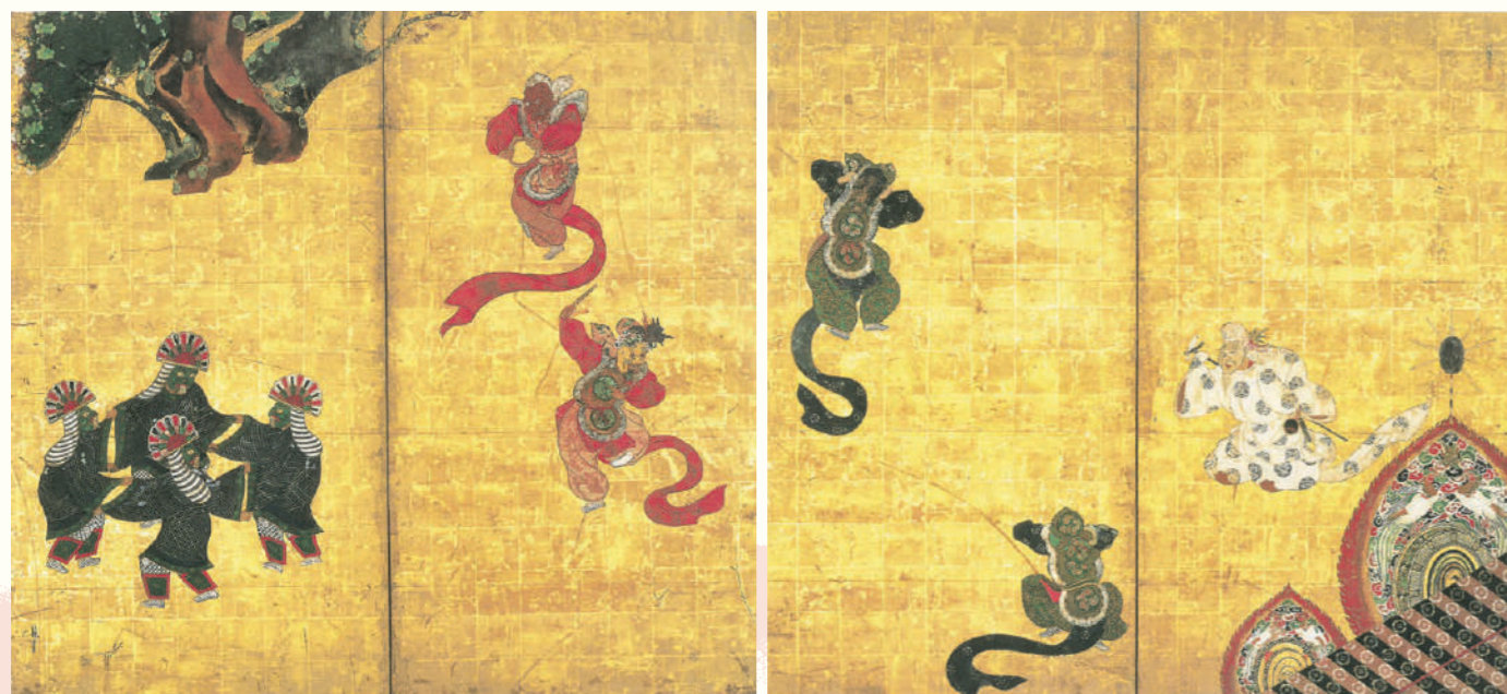
前期 First half 依屋宗達《舞楽図屏風》江戸時代 17世紀 醍醐寺蔵 重要文化財 Tawaraya Sotatsu, Bugaku Dancers , Edo period, 17th century, Daigoji Temple, Important Cultural Property