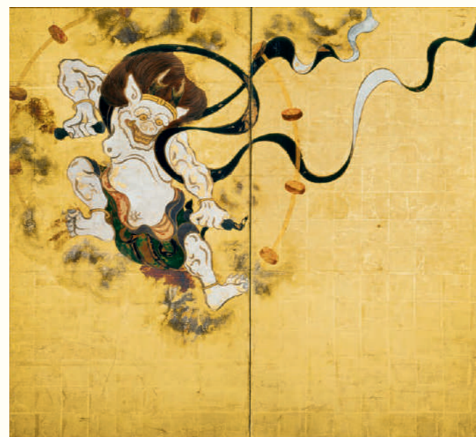
後期 Second half 依屋宗達《風雷神神図屏風》江戸時代 17世紀 建仁寺蔵 国宝 Tawaraya Sotatsu, Wind God and Thunder God , Edo period, 17th century, Kenninji Temple, National Treasure