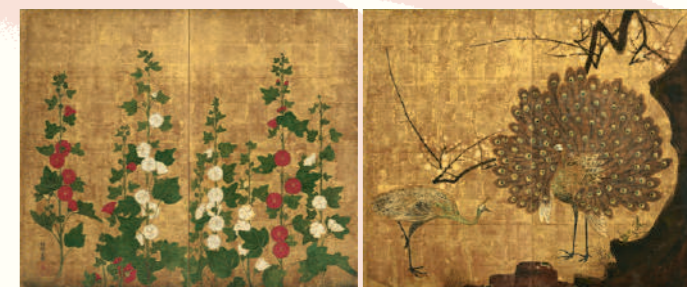
尾形光琳《孔雀立葵図屏風》江戸時代 18世紀 石橋財団アーティゾン美術館蔵 重要文化財 Ogata Korin, Peacocks and Hollyhocks , Edo Period, 18th century, Artizon Museum, Ishibashi Foundation, Important Cultural Property