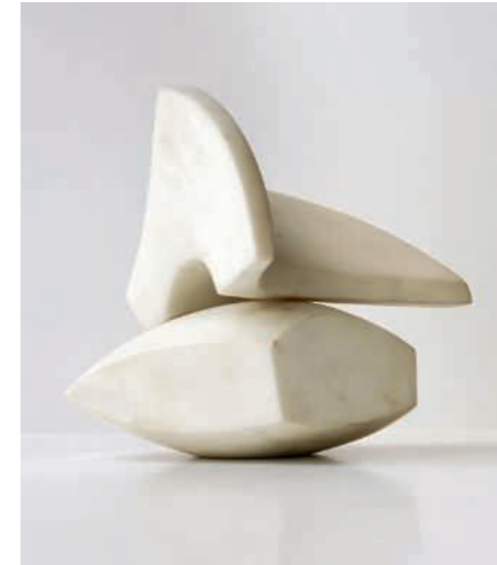
ジャン・アルプ 《貝殻-帽子》 1965年、アルプ美術館バーンホフ・ローラントシュヴェルト

Jean ARP after Sophie TAEUBER-ARP Untitled 1950s, Stiftung Arp e. V., Berlin/Rolandswerth C4772