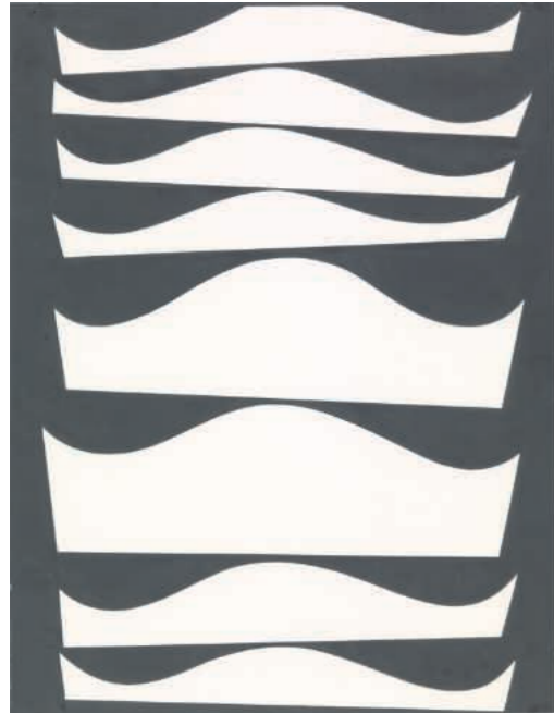
ゾフィー・トイバー=アルプ 《漸次的な移行》 1934年 アルプ財団、ベルリン/ローラントシュヴェルト

Sophie TAEUBER-ARP, Gradation 1934, Stiftung Arp e. V., Berlin/Rolandswerth