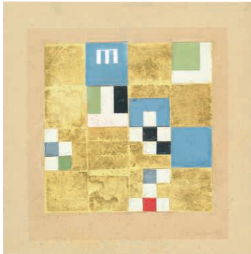
ゾフィー・トイバー=アルプ 《さまざまな要素のある垂直-水平の構成》 1919-38年頃、アルプ財団、ベルリン/ローラントシュヴェルト

Sophie TAEUBER-ARP Modular Cabinet (gray shelves) c. 1929, Fondation Arp, Clamart