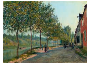
アルフレッド・シスレー 《サン=マメス六月の朝》 1884年、石橋財団アーティゾン美術館 Alfred SISLEY, June Morning in Saint-Mammès , 1884, Artizon Museum, Ishibashi Foundation

This exhibition showcases masterpieces from the Ishibashi Foundation Collection, including nineteenth- and twentieth-century modern Western art, art from the early twentieth century to the present day with a focus on Abstract Expressionism, and Japanese modern and contemporary art. *Please see the website for dates and fees.