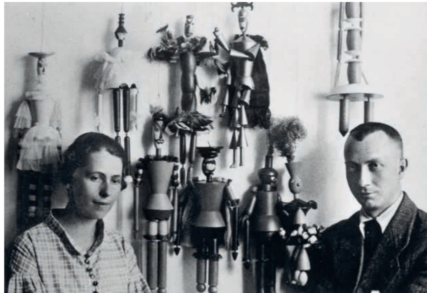
人形劇「鹿の王」のための人形の前の ゾフィー・トイバーとジャン・アルプ 1918年、チューリッヒ

Sophie TAEUBER-ARP, Composition with Vase Porter 1928, Stiftung Arp e. V., Berlin/Rolandswerth