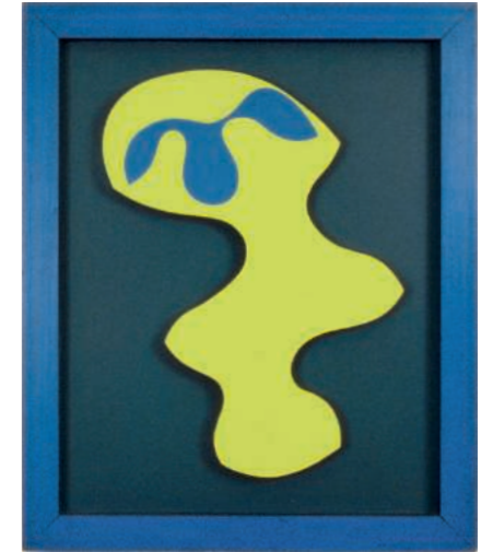
ジャン・アルプ 《花の頭部をもつトルソ》 1924年、アルプ財団、クラマール

Jean ARP (1886-1966) Born in Strasbourg, Germany (now part of France). Studied art in Germany and in Paris. He took part in Der Blaue Reiter (The Blue Rider) and Dadaism. From the 1920s, he made his way between Surrealism and Abstraction, with collage, relief, and sculpture as his primary creative terrain.