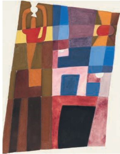
ゾフィー・トイバー=アルプ 《壺を運ぶ人のいる構成》 1928年、アルプ財団、ベルリン/ローラントシュヴェルト

Sophie TAEUBER-ARP, Gradation 1934, Stiftung Arp e. V., Berlin/Rolandswerth