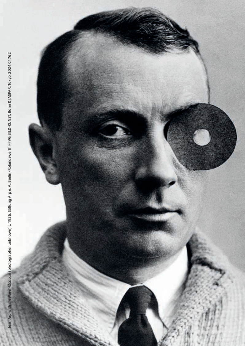
Jean Arp with the Merve-Monocle (photographer unknown) c. 1926, Stiftung Arp e. V., Berlin/Rolandswerth © VG BILD-KUNST, Bonn & JASPAR, Tokyo, 2024, CA762