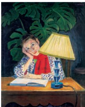
碓伊之助《燈下》 1941年、碓伊之助美術館 HAZAMA Inosuke, Under Lamplight , 1941, Hazama Inosuke Museum

Following his debut at the Fusain-kai, Hazama Inosuke was not only active as a painter. He also, for a time, provided guidance at Tokyo University of the Arts and, in his later years, engaged in creating overglaze-enamelled porcelain. Besides his creative activities, he was also a collector and the coordinator of Japan's first Matisse exhibition. This exhibition introduces the many different facets of his distinguished career.