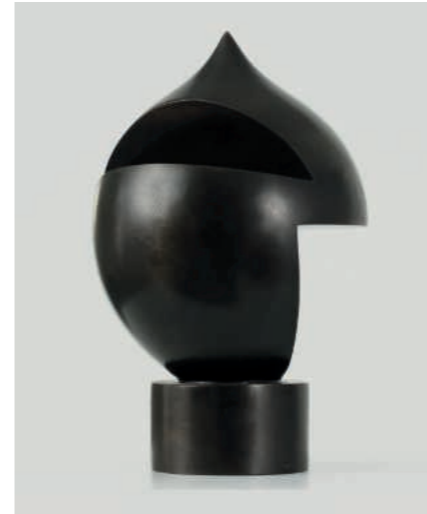
ジャン・アルプ (ゾフィー・トイバー=アルプの作品に基づく) 《無題》 1950年代、アルプ財団、ベルリン/ローラントシュヴェルト

Sophie TAEUBER-ARP, Jean ARP Dessin (Duo-dessin) 1939, Stiftung Arp e. V., Berlin/Rolandswerth