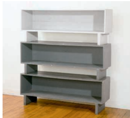
ゾフィー・トイバー=アルプ 《調節可能家具 (グレーの棚)》 1929年頃、アルプ財団、クラマール

Jean ARP, Torso with the Head of Flower 1924, Fondation Arp, Clamart © VG BILD-KUNST, Bonn & JASPAR, Tokyo, 2024 C4772