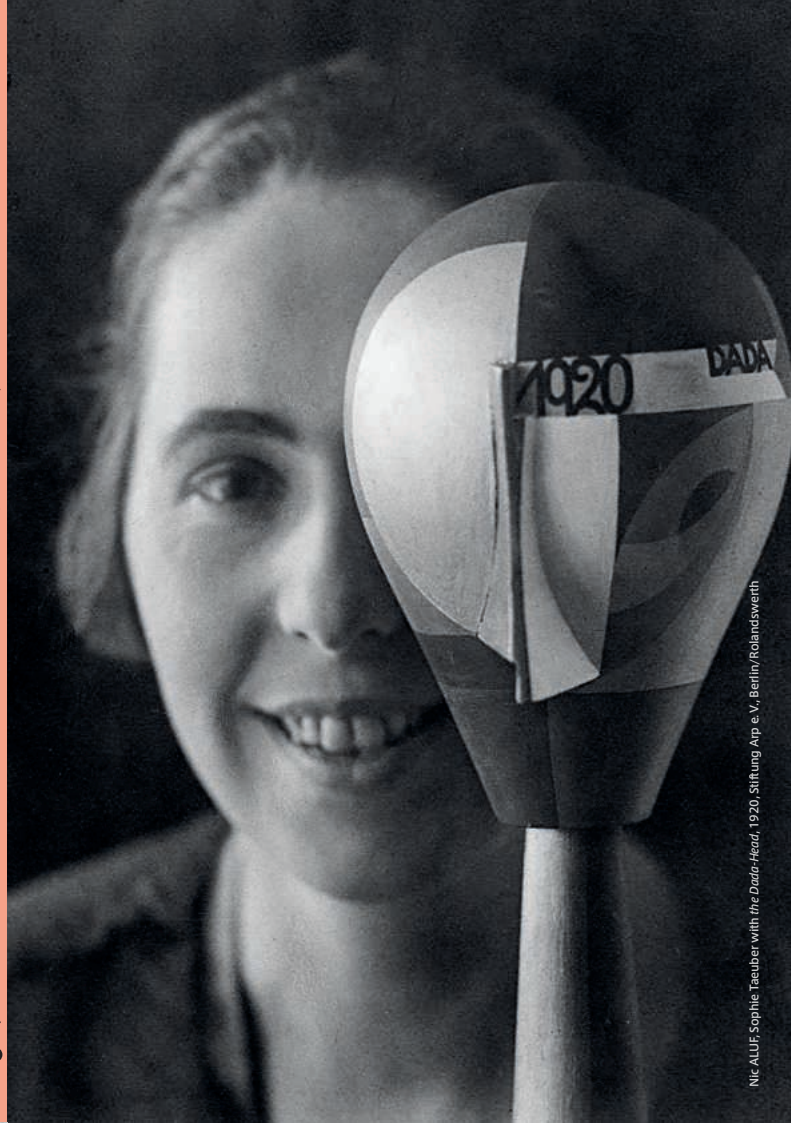
Nic ALUUF Sophie Tauber with the Dada-Head, 1920, Stiftung Arp e. V., Berlin/Rolandswerth

Under the auspices of Embassy of the Federal Republic of Germany, Goethe-Institut Tokyo, Embassy of France / French Institute of Japan, Embassy of Switzerland