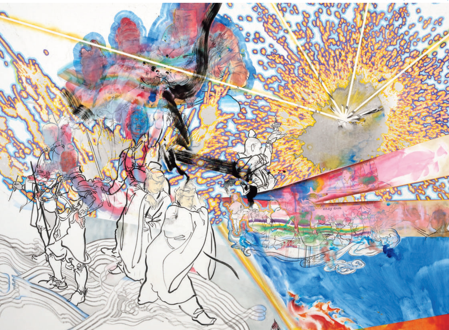
山口晃(紫雲園) (部分) 2015年 水彩画 墨線 図案 著 YAMAGUCHI Akira, Raijō(detail), 2015, collection of the artist. Photo: MIYAJIMA Kei

©YAMAGUCHI Akira, Courtesy of Mizuma Art Gallery