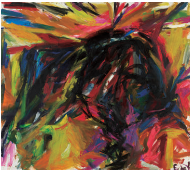
エレイン・デ・クーニング《無題(闘牛)》1959年 Elaine DE KOONING, Untitled (Bullfight) , 1959 © Elaine de Kooning Trust