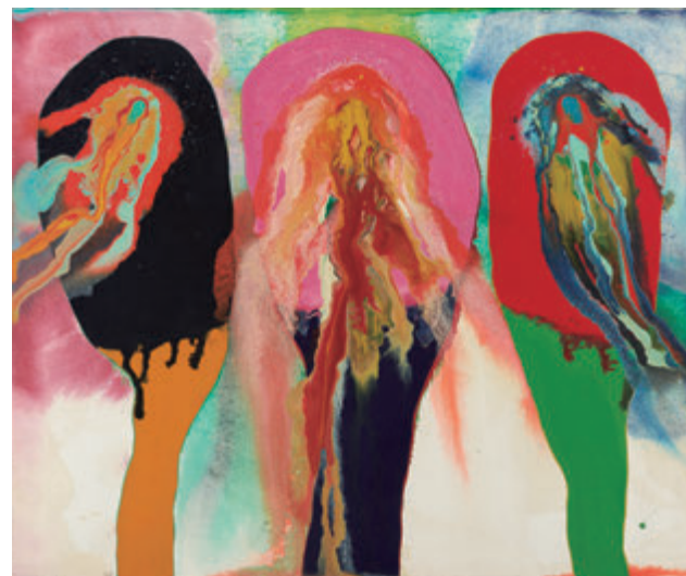
元永定正《無題》1965(昭和40)年 MOTONAGA Sadamasa, Untitled , 1965