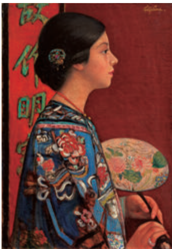
藤島武二《東洋振り》1924(大正13)年 FUJISHIMA Takeji, Orientalism , 1924