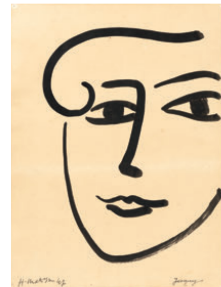
アンリ・マティス《ジャッキー》1947年 Henri MATISSE, Jacquy , 1947