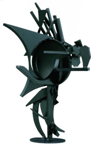
デイヴィッド・スミス《8月の大鴉》1960年 David SMITH, August Raven , 1960