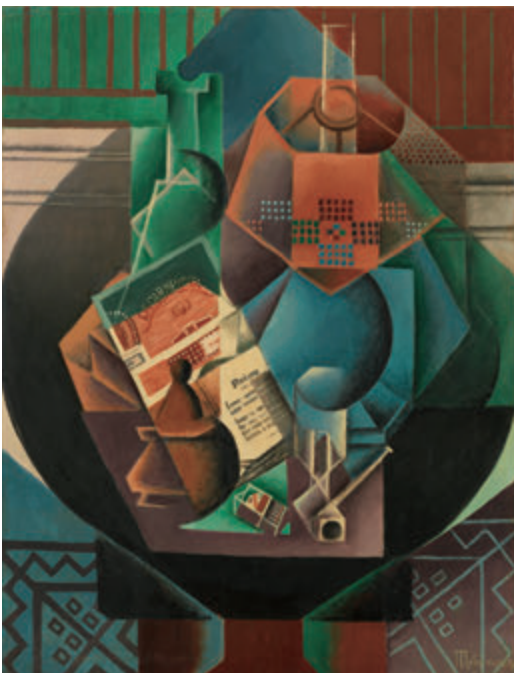
ジャン・メッツァンジェ《円卓上の静物》1916年 Jean METZINGER, Still life on a Pedestal Table , 1916